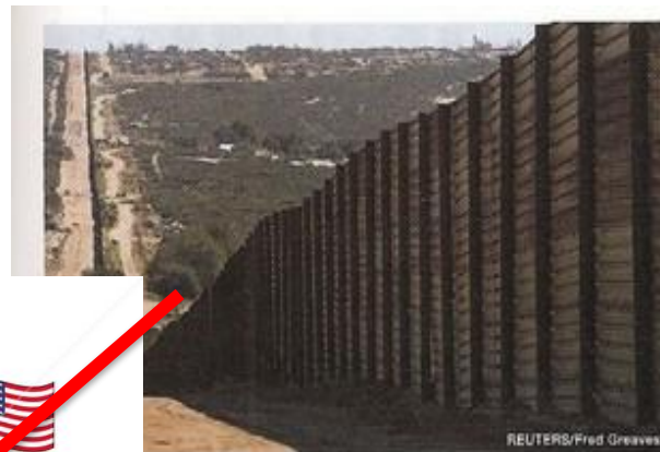
キシコの国境線上に建てられた鉄の壁